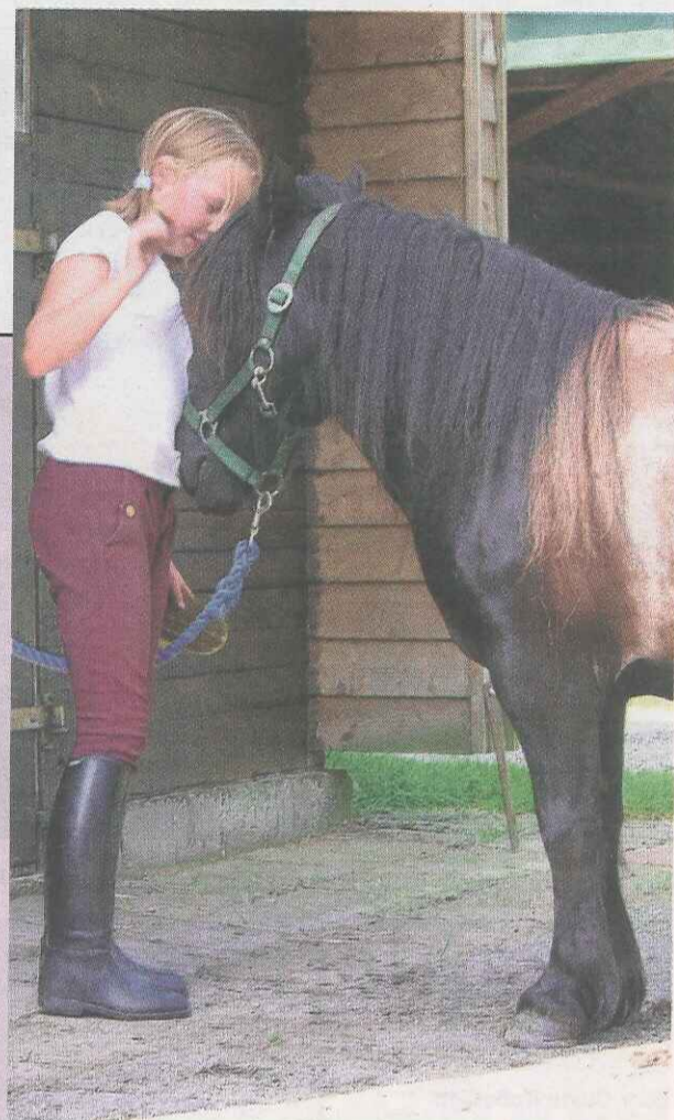
Info-avond in Zwolle over paardrijden.